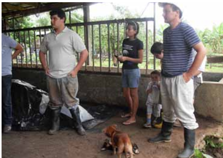
Sesión de acompañamiento y asesoría in situ a un grupo de jóvenes, apoyándoles en la creación de un centro de acopio y empacadora de frutas y verduras en la zona de Valle Verde de Aguas Claras de Upala.