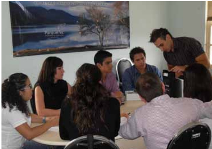
Sesión de acompañamiento y asesoría a grupo de estudiantes de la UCR, proceso de transición del ejercicio académico hacia la creación de una empresa de base tecnológica.

empresario(a) y de su empresa. Con base en estos Planes de Desarrollo, se inicia un proceso de acompañamiento (personalizado o colectivo), en las áreas consideradas más débiles.