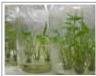
4 años de impulsar de una cultura emprendedora el desarrollo